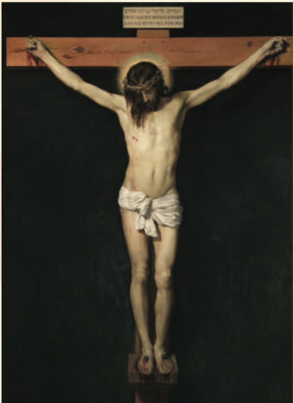
■ Diego Velázquez, Cristo crucifisso