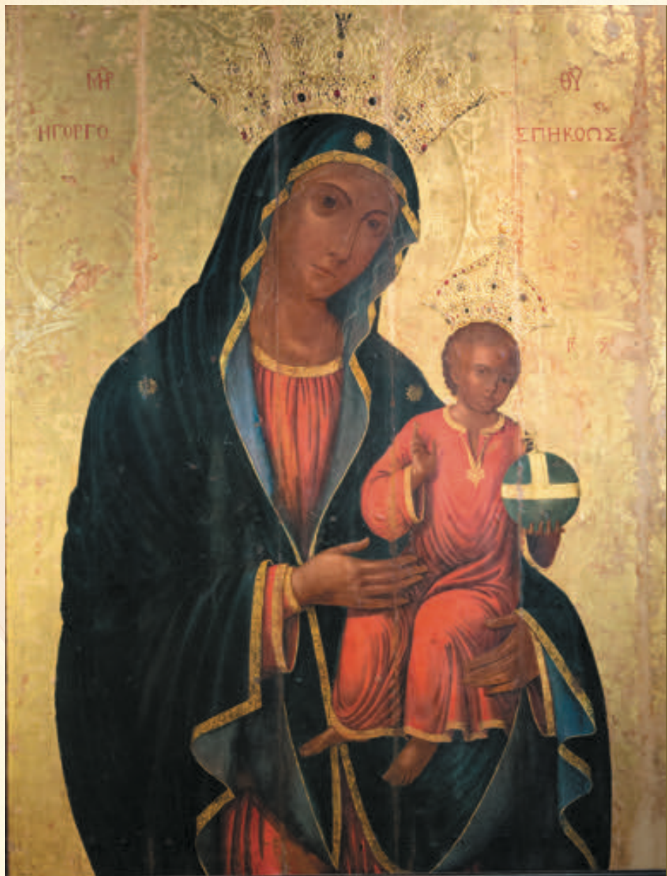
■ Santa Maria della Lettera "Veloce Ascoltatrice"