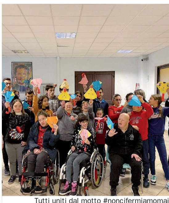
Tutti uniti dal motto #noncifermiamomai